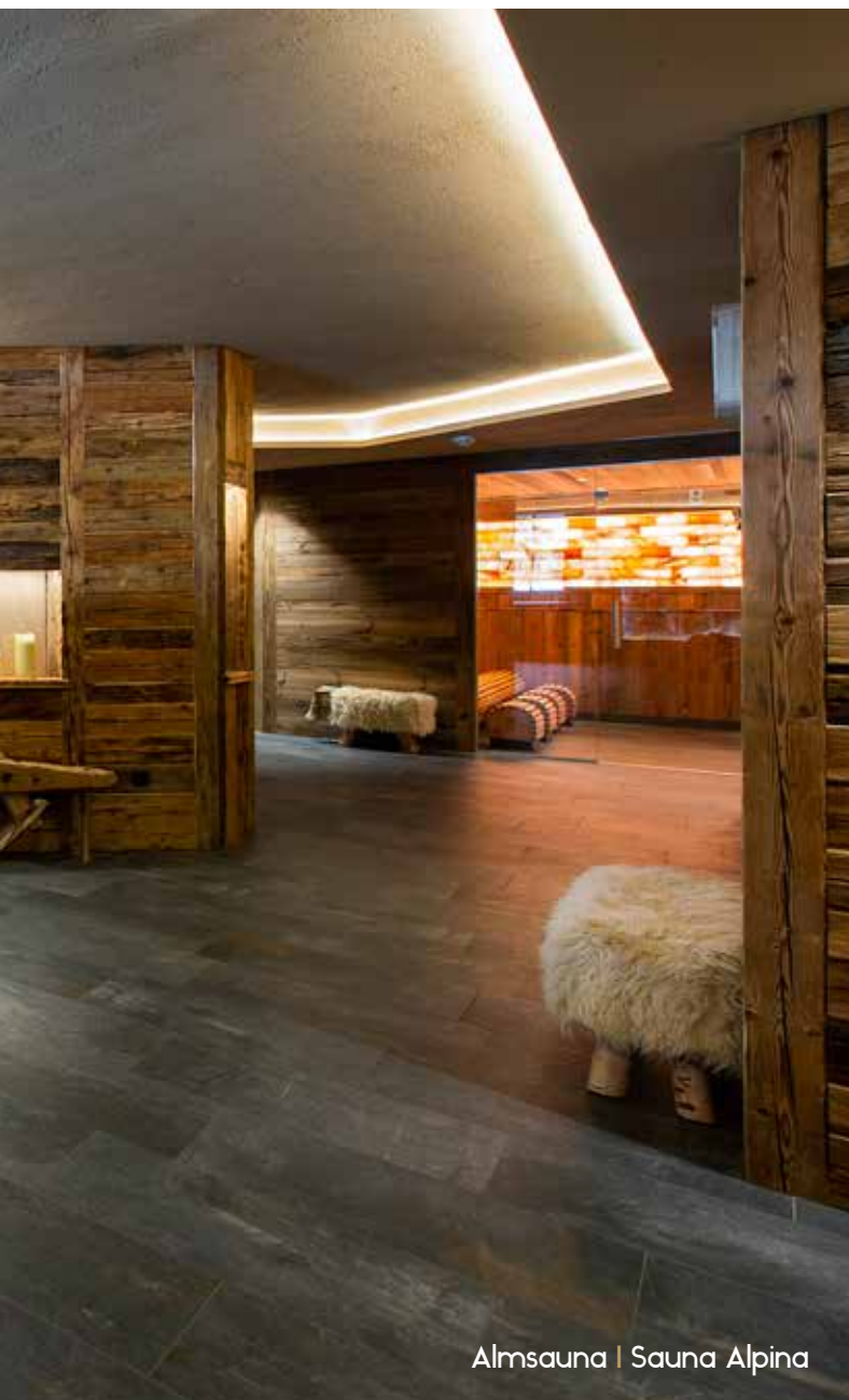
Almsauna | Sauna Alpina