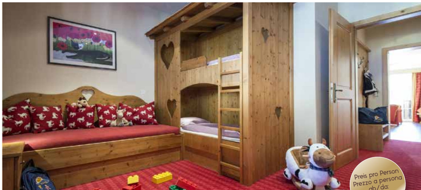
Happy Family Suite (ca. 70 m 2 )

Preis pro Person Prezzo a persona ab/da: € 209,00.-