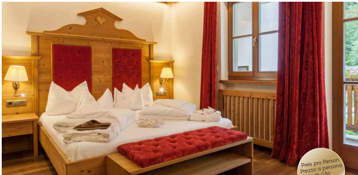
Doppelzimmer Kuschelnest / Camera matrimoniale Nido Coccole (ca. 22 m 2 )

Preis pro Person Prezzo a persona ab/da: € 159,00.-