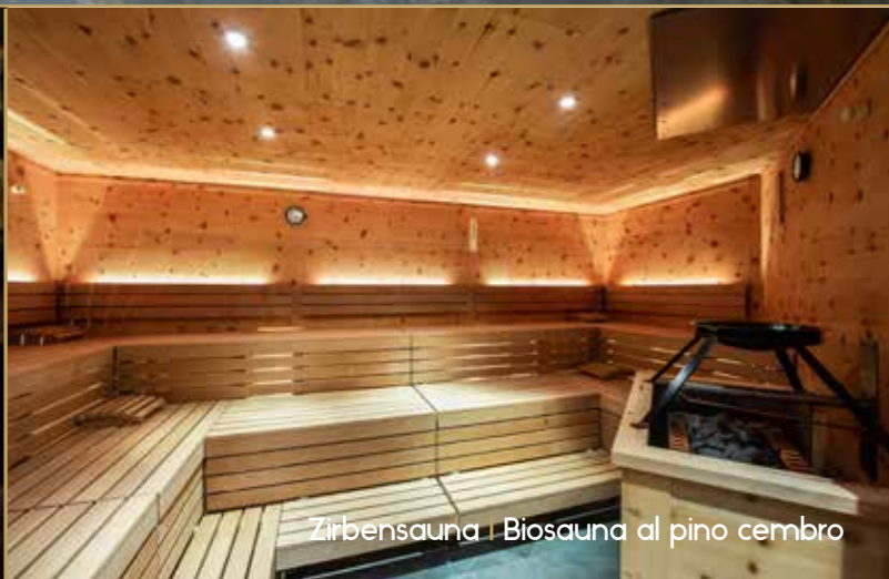
Zirbensauna | Biosauna al pino cembro