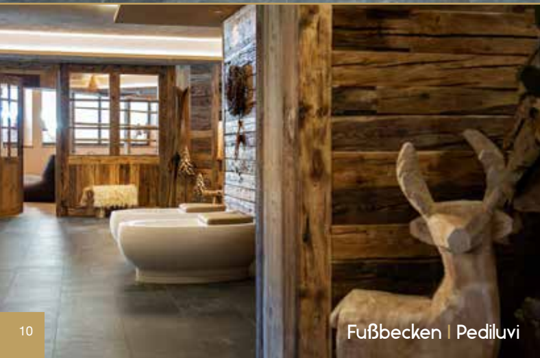
Fußbecken | Pediluvi