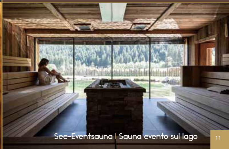
See-Eventsauna | Sauna evento sul lago