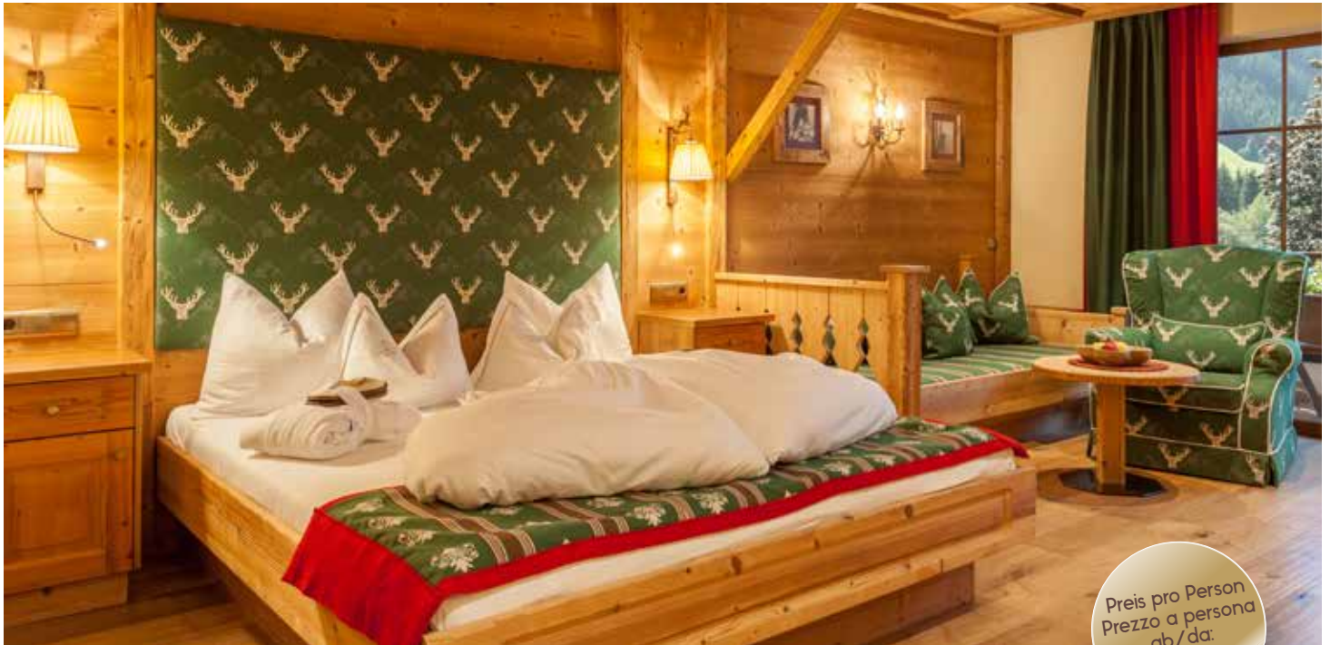
Suite Tirol (ca. 50 m 2 )

Preis pro Person Prezzo a persona ab/da: € 206,00.-