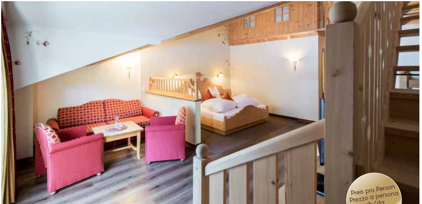
Family Suite *Heidi* (ca. 50 m 2 ) + Mansarde/mansarda

Preis pro Person Prezzo a persona ab/da: € 206,00.-