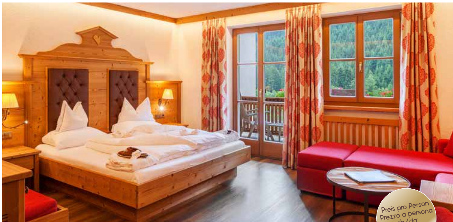
Doppelzimmer Sunshine / Camera matrimoniale Sunshine (ca. 28 m 2 )

Preis pro Person Prezzo a persona ab/da: € 159,00.-